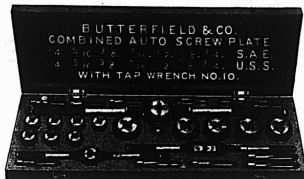
Série Derby spéciale combinée pour auto.

Demandez notre dernier catalogue Numéro 18