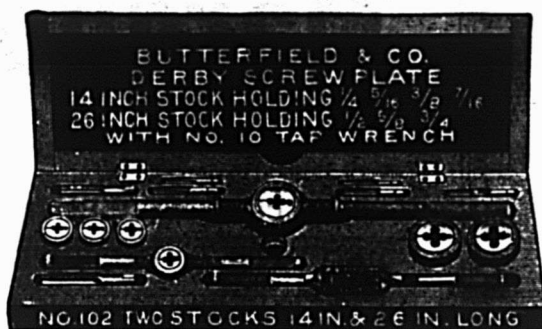
Série de tarauds et Coussinets Derby No 102.