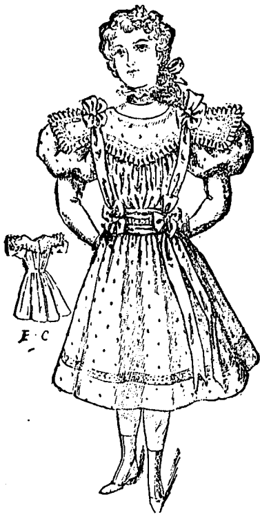
7046 - Robe de fillette montante ou décolletée.

Une batiste fleurie de dessins vert-pâle et violet garnie d'insertion écru et de ruban en taffetas fera une jolie robe comme celle que nous voyons sur la vignette. Le corsage à bouffant repose sur une doublure qui n'est ajustée que sur les épaules et dessous les bras. On ne doit pas voir la couture dans le dos, laquelle se dissimule dans le plissé. On ajuste les plissés en bas du cou et autour du buste; dans le patron vous aurez deux modèles, l'un pour un collet montant, l'autre devant être porté si la robe est basse. La jolie berthe bordée d'une insertion et d'une ruche en ruban tombe sur les épaules et forme un pointu en avant et en arrière. On peut très bien arranger un gros bouffant sur le haut de la manche qui retombe sur une manche collante et bien ajustée, ou on peut enlever la manche entièrement et finir le bouffant par une étroite bande d'insertion. Un ruban d'une jolie teinte de violet est fixé en nœuds élégants sur les épaules et autour de la taille se terminant au côté gauche par de longs bouts flottants.