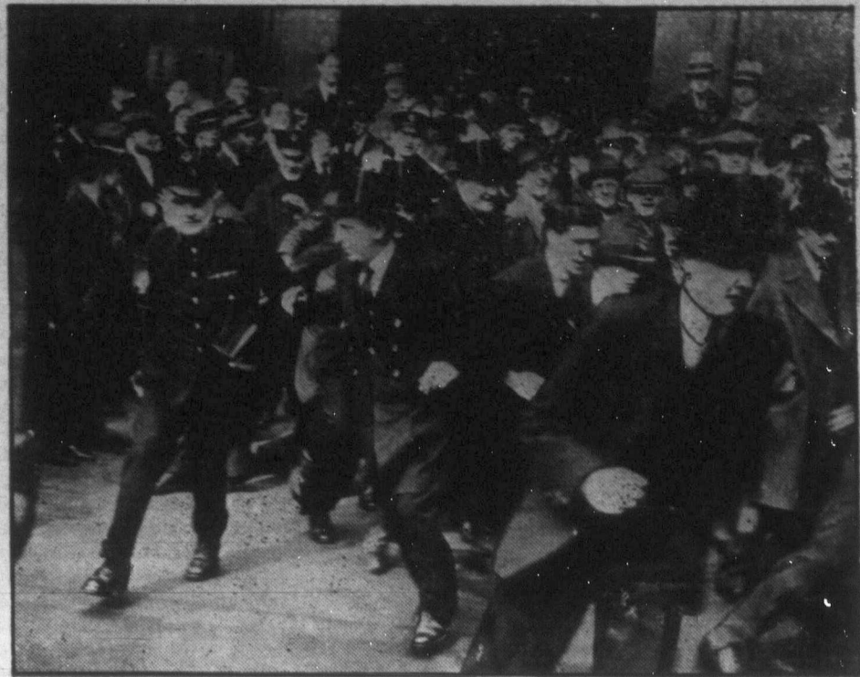
Nem cilinderbe bújatott munkanélkülieket oszlatnak szét fenti képünkön a londoni "Bobby"-k, hanem a földkerekség talán legfontosabb árutörsdjére tolatodók között akarnak egy kis rendet csinálni Anglia fővárosának rendőrei. Képünk tanúsága szerint Londonban még manapság is komolyan és szigorúan ragaszkodnak az illetlen öltözködési szabályaihoz — legalábbis a tözsdén. Megfigyelhetjük azt is, hogy a tömeglélektan törvényei éppennygy érvényesülnek akkor is, ha overall helyett történetesen frakk van is az embereken.

A mi összes rokonnépeink hitvilága ilyenföli távol állott. Hiedelmük a samánizmus volt, annak is az a kezdetlegesebb fo-