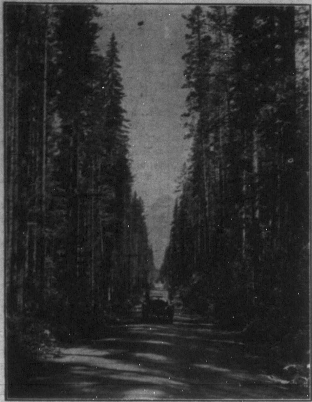
Szebbnél szebb részletekben bővelkedik a Trans-Canada műút nemrég megnyitott Winnipeg-Kenora közötti szakasza, mely máris igen sok turistát vonzott az Egyesült Államokból is, akik viszont dollárjaikkal sokat lendítenek az ország kereskedelmi forgalmán.