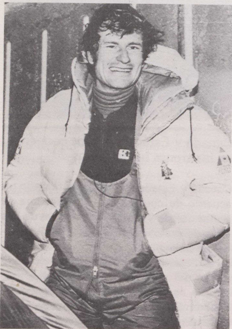
Laurie Skreslet el primer canadiense en ascender a la cima.

Estos dos canadienses son miembros del equipo canadiense de ocho personas, una de las veintiseis expediciones que completaron la ascensión de 8.848 metros de altura después que Sir Edmund