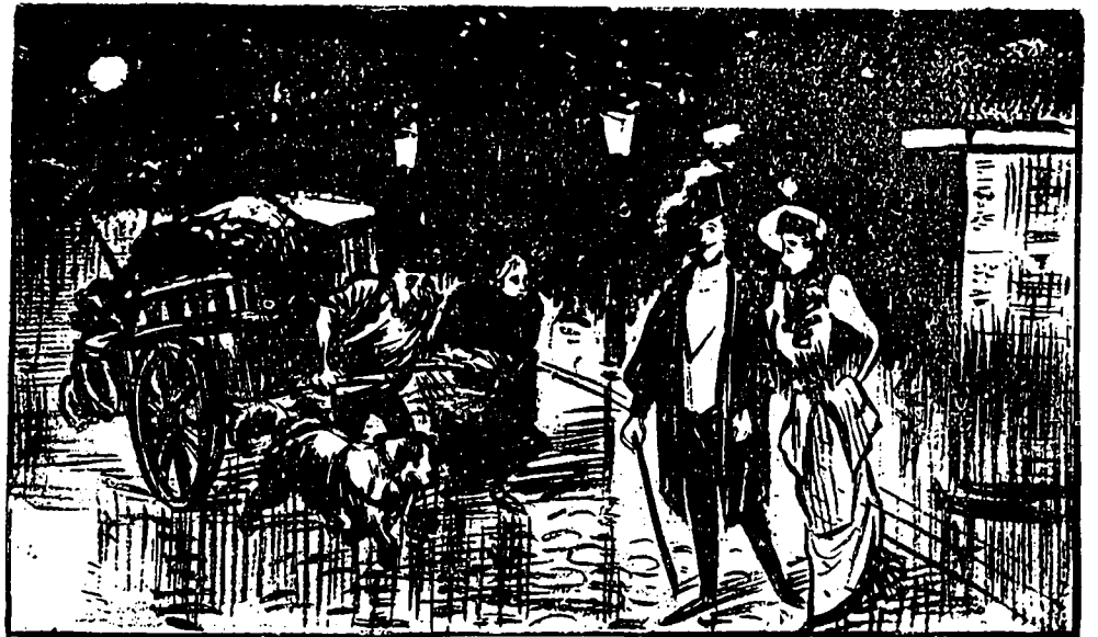
Les père et mère de la grande dame.