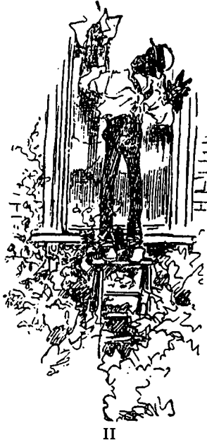
II Les arbres qu'elle avait vus.