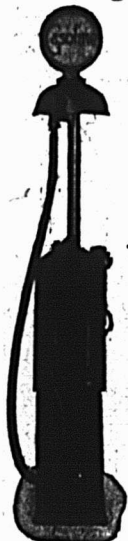
Fig. 241. Ins- tallation pour gazoline.

vous font écono- miser de l'huile et de l'argent.