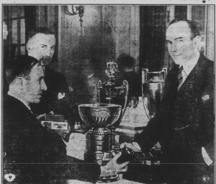
Lors du banquet offert à Montréal, le 8 avril à l'équipe de hockey "Le Canadien", qui vient de remporter pour la seconde fois consécutive la coupe Stanley, emblème du championnat du monde, la compagnie Gillette présentait à chacun des joueurs un rasoir de cette marque et le service complet pour la barbe, avec le nom de l'individu entouré de feuilles d'érable, gravé en or.