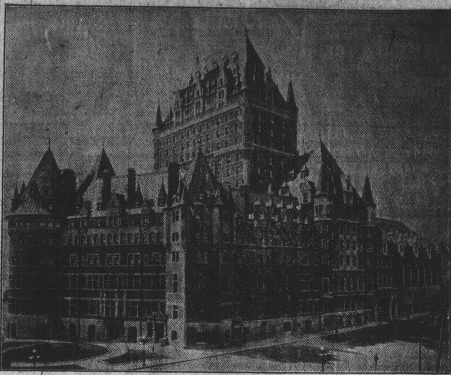
Le Château Frontenac a Repris sa Splendeur

PROCTEUR DU COLLEGE DE SAINTE- ANNE-DE-LA-POCATIERE Comté de Kamouraska.