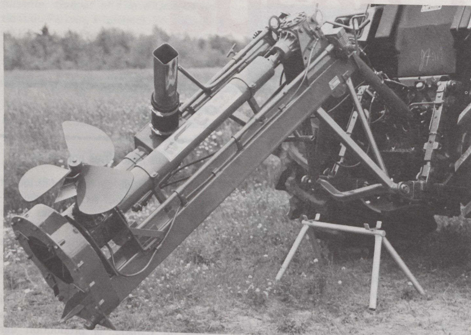
L'Agi-Pompe illustrée dans la photo est la première pompe capable de transformer le fumier liquide en un riche fertilisant. La société J. Houle & Fils Inc., de Drummondville (Québec), en est le fabricant.