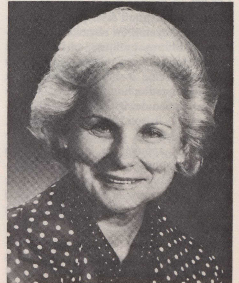
Mme Sauvé, ministre des Communications

L'une de mes responsabilités à titre de ministre des Communications — en fait, elle est inscrite dans la Loi sur le ministère des Communications — est de "favoriser l'établissement, la mise au point, le développement et l'efficacité de systèmes et installations de communication pour le Canada". C'est là une grave responsabi-