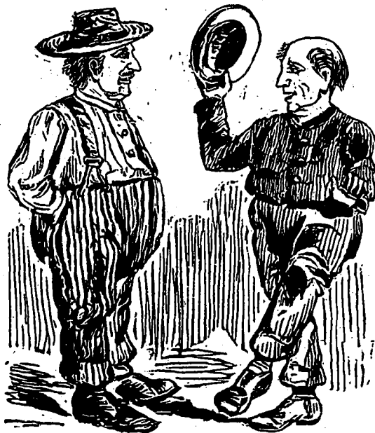
LA SITUATION ACTUELLE.