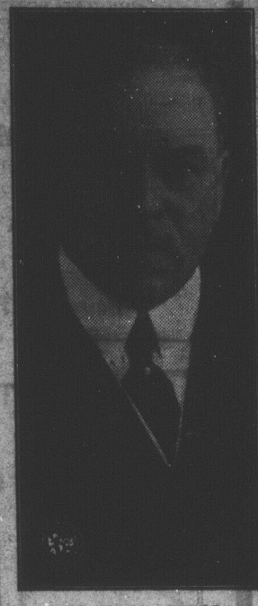
L'hon. MacKenzie KING, actuellement en tournée politique aux Provinces Maritimes, en vue des prochaines élections fédérales.