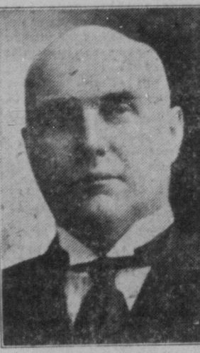
Hon. Charles Stewart.

"Förebygg skogsbrand" är slagor- det för dagen över hela landet. In- rikesministern, Hon. Chas. Stewart, i samråd med provinsregeringarna och