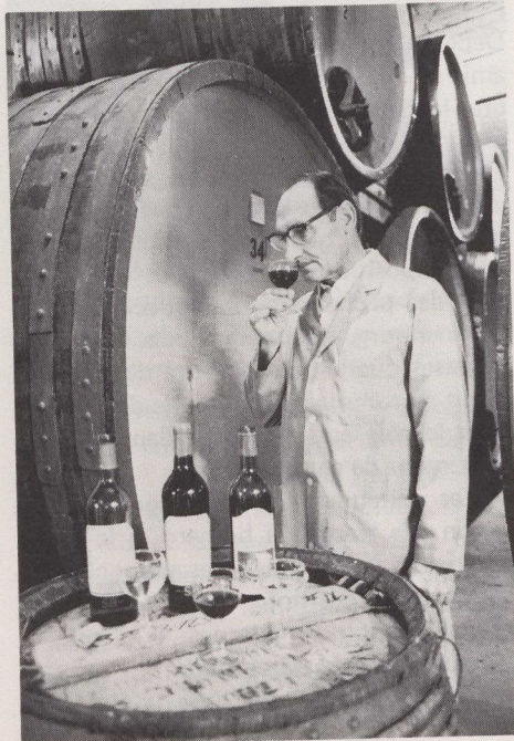
Un dégustateur de vin à Penticton.

Extrait d'un article de Christine Trépanier, Billet touristique , Office de tourisme.