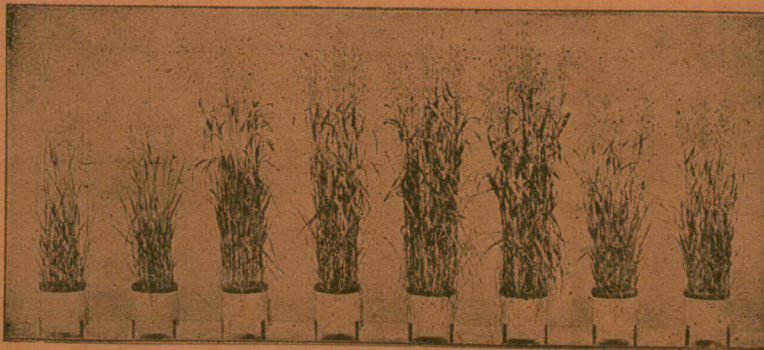
Pas de Phosphate. Engrais Scorie Basic ordinaire. Engrais Albert Thomas-Phos. Powder. Engrais Farine d'os.

Quantité égale d'acide phosphorique à toutes ces expérience .