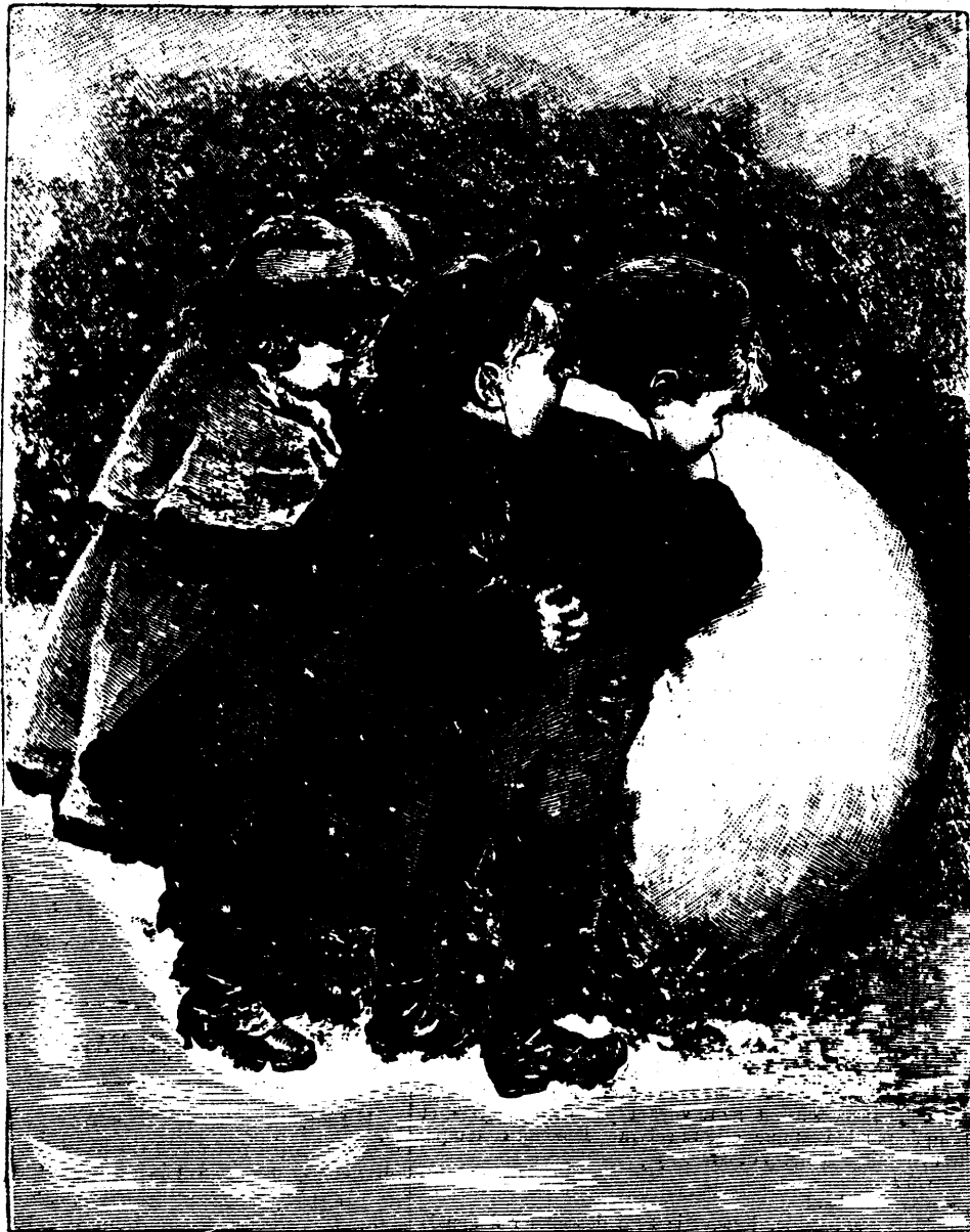
L'UNION FAIT LA FORCE