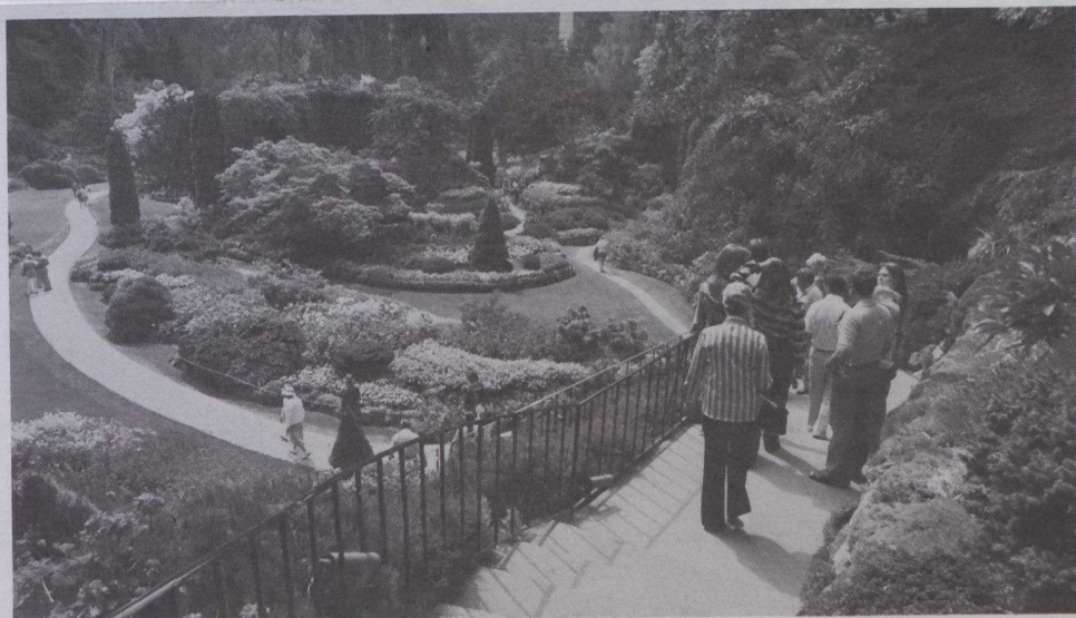
Los jardines Butchart, cerca de Victoria, Colombia Británica, fueron construidos en una vieja cantera y resplandecen de color durante todo el verano.

Según avanza la estación, van floreciendo diferentes especies florales, iniciadas por los narcisos que crean un tapiz dorado al lado del lago, mientras que los tulipanes se mezclan con nomeolvides rosas y azules durante la primavera. En verano florecen las bocas de dragón, trinitarias, pajarillas, malvas, claveles, claveles de Japón, digitales y la azucena atigrada. Al oscurecer, los jardines adquieren nueva belleza con la iluminación de 1.000 luces ocultas.