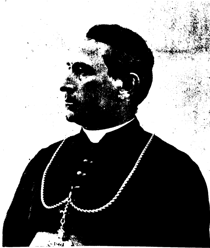
MGR LORRAIN, ÉVÊQUE DE PONTIAC.

La ligne, par insertion - - - - - 10 cents Insertions subséquentes - - - - - 5 cents Tarif spécial pour annonces à long terme