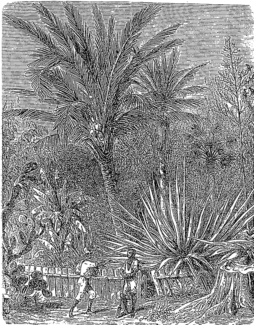
L'ENTRÉE D'UNE PLANTATION.