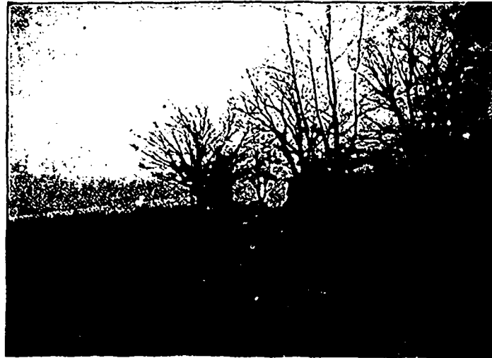
Cette gravure représente l'aspect d'une clôture en fil de fer tissé Page, en usage. Si par hasard vous n'étiez pas bien renseigné sur cette clôture, envoyez votre adresse à la Page Fence Co., Walkerville, Ont., et ils vous enverront leur matière à annonce, contenant plusieurs gravures comme ci-dessus. Gratis.

BROOK HILL, Ayrshires. — Juste un jeune taureau de race prêt pour le service. Un magnifique animal. Nous enregistrons maintenant les ordres pour taureaux, génisses, veaux, provenant de riches laitières et engendrés par "Uncle Sam" de Taubt River 6974. Prix approximatifs au temps. W. E. & J. A. Stephen, Trout River, Qué. G-26 12.