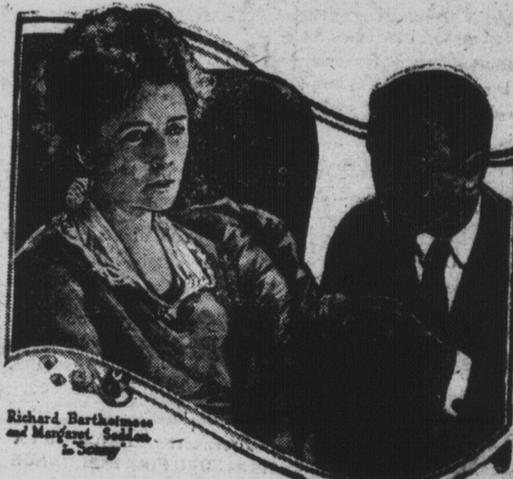
Richard Barthelmess and Margaret Sedgwick in Sonny