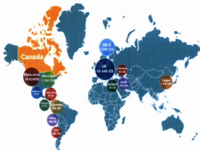
Pays et zones économiques qui ont des accords de libre-échange avec le Canada, 2016 Produit intérieur brut (PIB) (dollars américains)