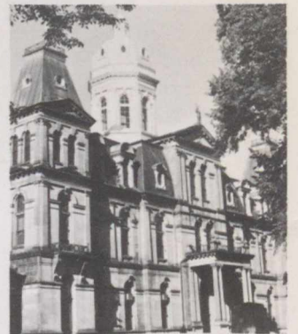
Fredericton : le Parlement provincial.

Les électeurs du Nouveau-Brunswick ont renouvelé en novembre dernier, avec une carte électorale modifiée et pour la première fois le droit de vote à dix-huit ans, les cinquante-huit sièges de l'assemblée législative de la province. Ils ont maintenu leur confiance au parti conservateur, dont le leader est M. Richard Hatfield, premier ministre, en élisant trente-trois députés de ce parti (contre trente-deux en 1970); le parti libéral a obtenu les vingt-cinq autres sièges. L'apparition de deux nouveaux partis sur la scène provinciale, le Parti acadien et le