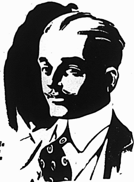
Nouvelle forme ajustée