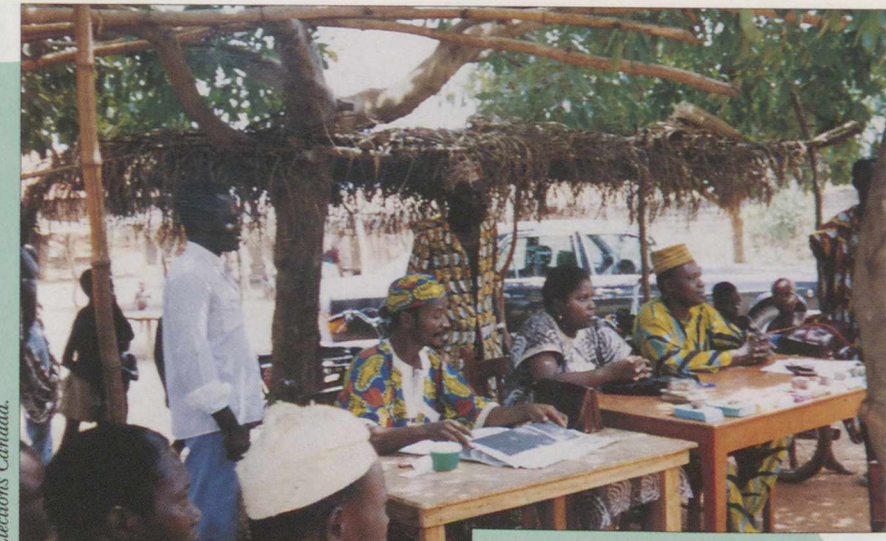
Ⓒ Tout est prêt pour le vote.