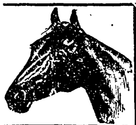
Marque de Fabrique