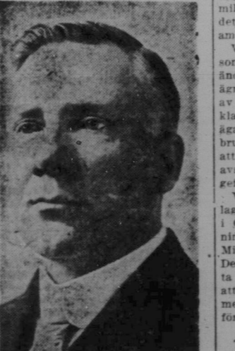
Hon. Thomas Johnson.

Det norsk-amerikanska hundraårsjubileet med exposition på Minnesota statstillings område mellan St. Paul och Minneapolis från den 5 till och med den 9 nästkommande juni blir den största folkfest i Amerika under 1925, skriver Sv. Trib-Nyh. Man beräknar, att mellan 250,000 till 500,000 personer komma att besöka utställningen under de fyra dagar som varar.