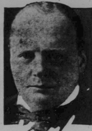
Winston Churchill, som vill återställa guldstandard för brittiska kejsardömet.