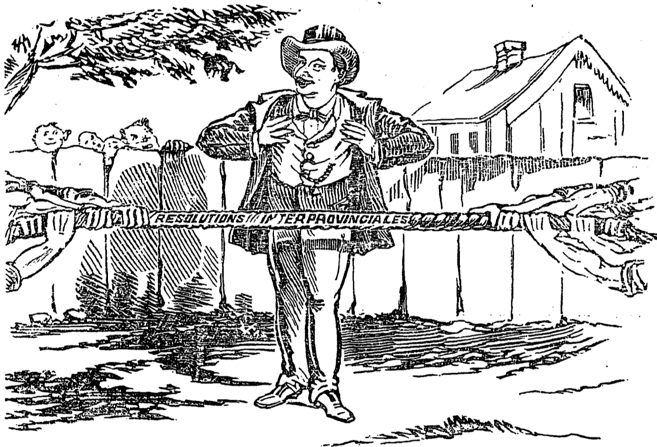
MERCIER, a'me et souriant—Ça changera d'ici à la prochaine session.

de bons calembourgs? Ne sont-ils pas tous plus ou moins mauvais? Si le mien est aussi innocent que vous le demandez, ne risquez-vous pas d'ennuyer les dames, auxquelles vous comptez le servir? Enfin, pour vous complaire, voilà votre calembourg.