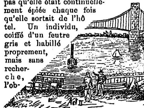
LA SEINE, SES PONTS, ETC.

La jeune fille ne se doutait pas qu'elle était continuellement épiée chaque fois qu'elle sortait de l'Hôtel. Un individu, coiffé d'un feutre gris et habillé proprement, mais sans recherche, l'observait.