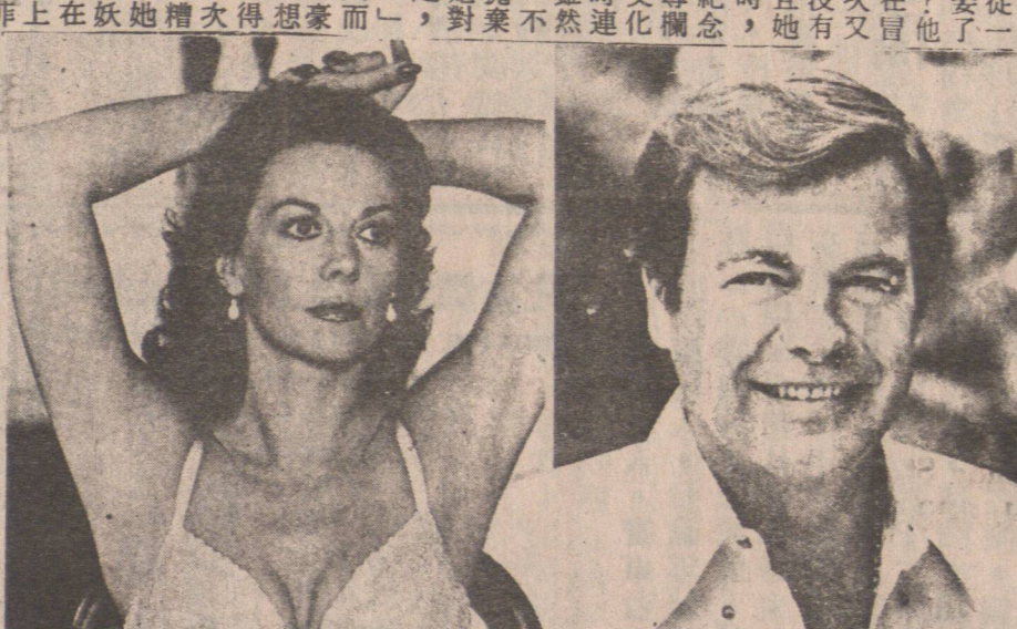
納拿拔羅與活梨姐妮——婦夫的合復而離對一的活里荷