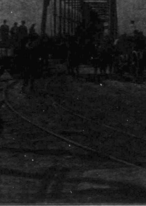
Den föräldrade bron vid Elmwood.