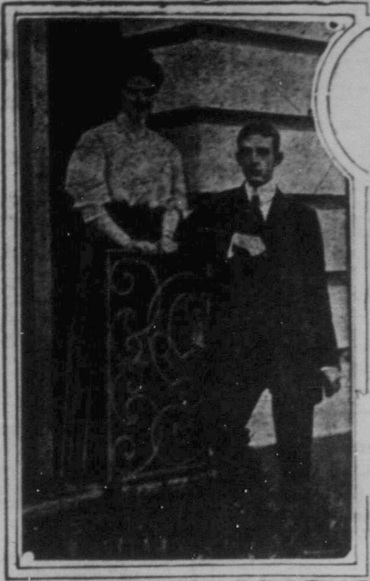
Furste-brölöp i St. Petersburg.

Förleden söndag blef prins Wilhelm af Sverige, konung Gustafs andre son, och storfurstinnan Maria Pavlovna föräldra. Den högtidliga akten förgick i Tsarsko-Selo-slottets kapell, i närvaro af representanter för alla europeiska höf och dignitärer från ryska kejsardömet. Konung Gustaf var själf närvarande. En väldig människomassa hade samlats utanför slottet och väntade i trots af snöryg till tillkännagivandet att akten var öfver. De nyföräldrade komma att tillbringa smekmånaden i storfurst Sergius slott i Petersburg.