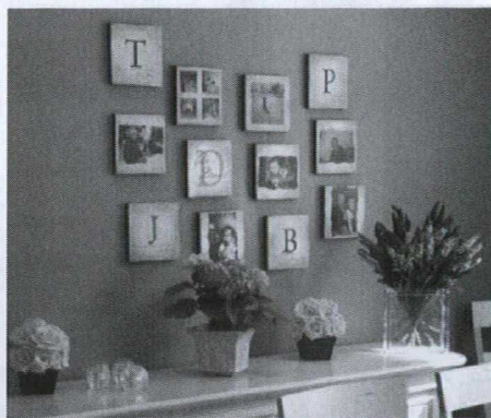
Les carreaux ornementaux de Tilano Fresco