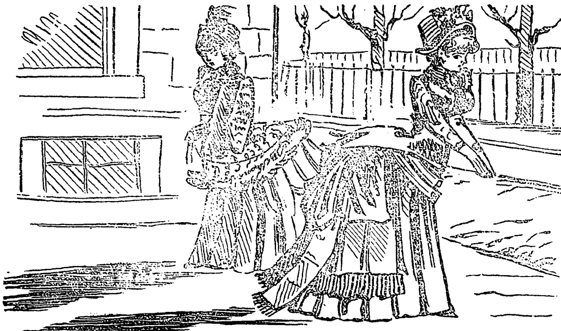
Et dire que l'on prétend que la tournure et le bustle tendent à s'en aller.

A la police correctionnelle : Le ministre public D...—Cocher, c'est un dimanche que l'accident vous est arri- vé, que vous avez écrasé cette pauvre dame ? Le cocher.—Non, m'sieu, c'était le 26 avril, jour de Pâques.