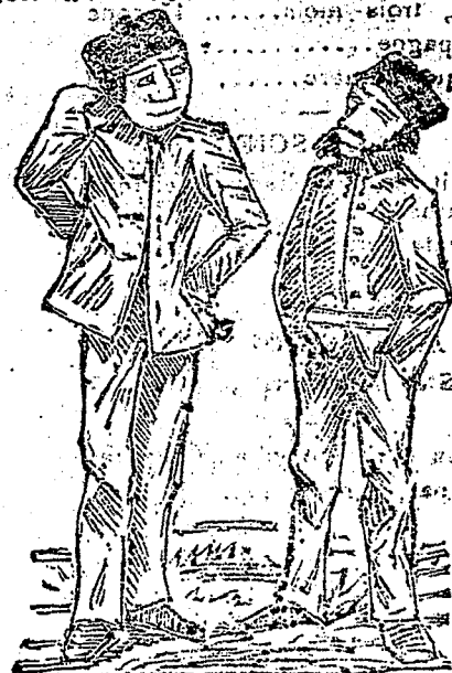
SCENES AUX FRONTIERES

—Mille tonnerres! on m'a changé mes bottes, tiens, deux pieds gauche!