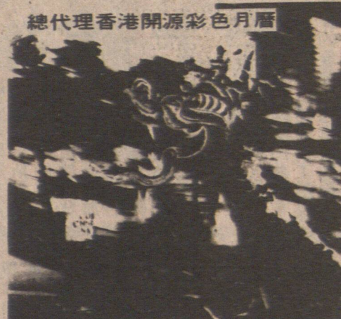
總經銷中國上海藝術月曆

更有中國名畫家關山月、程十髮、陳洞庭、華三川、吳青霞、黃幻吾等名國畫家的作品為主題的具有高度藝術水準的中國式月曆。 我們採取： 統一發運；當地加印廣告；當地釘裝供應等方法，盡可能內降低成本減輕消費者負擔。