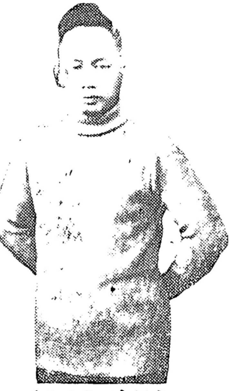
定搭度尺 結度法 (衫領罇) 由胸前橫量 至背後書明 若干英寸付 來無悞

良久爲僑胞歡迎蓋本公司所織造之掙紮專取合中國人身材尺度適合非比西人所造之衫有袖長及不襯身之憾而且價極廉平