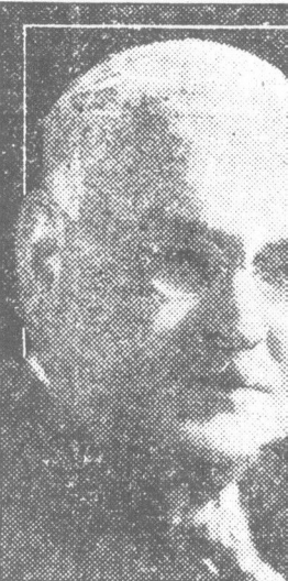
L'HONORABLE J.-L. PE

Qui a élaboré tout un program plus grand progrès de l'Agric