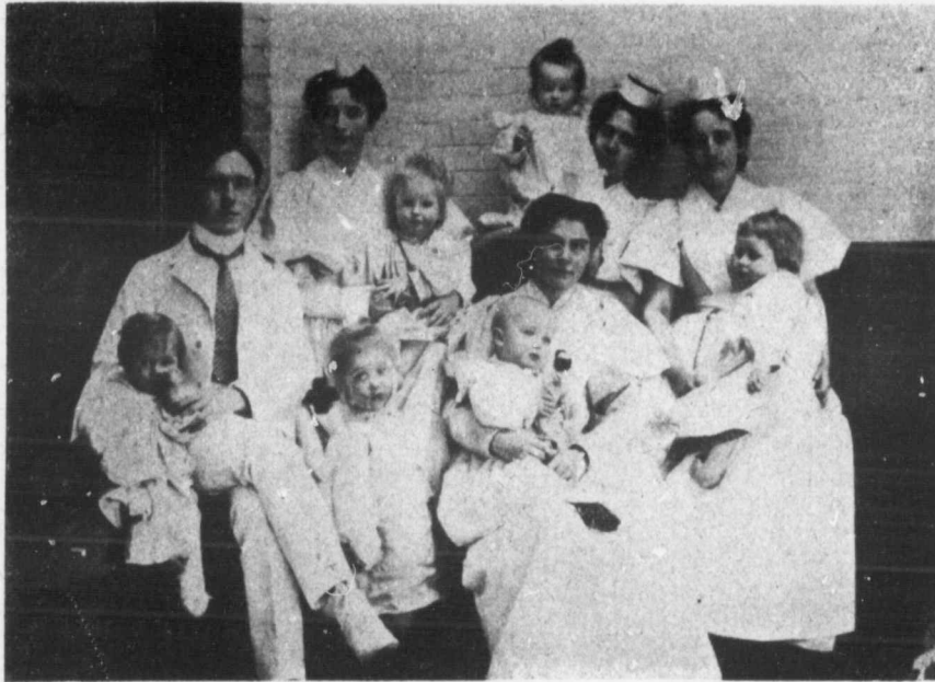
A GROUP IN THE BABY WARD, COLLEGE STREET BUILDING.