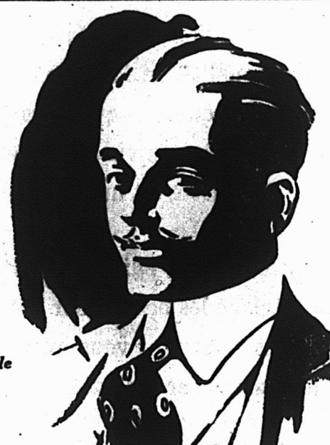
Nouvelle forme ajustée