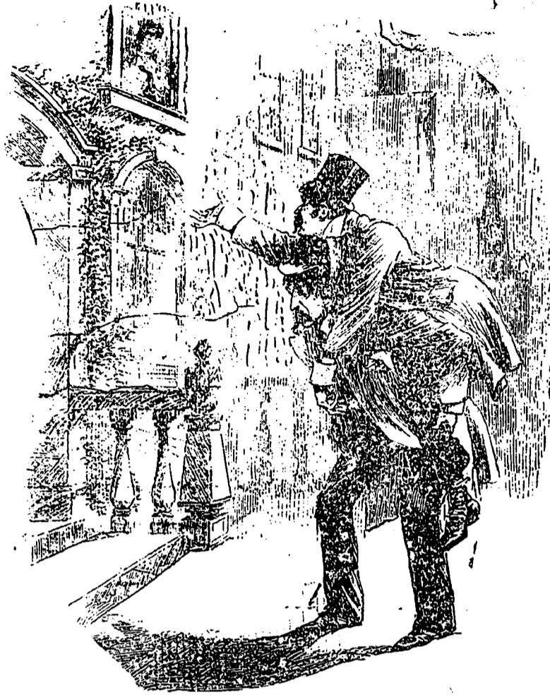
Arrivée triomphale, à 2 heures du matin, d'un candidat victorieux à une élection de bazar.