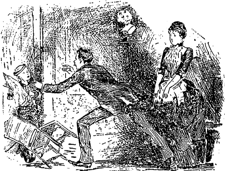
LE PETIT FRÈRE, entrant—Champagne est élu dans Hochelega ! LUI, s'élançant—Par quelle majorité ?