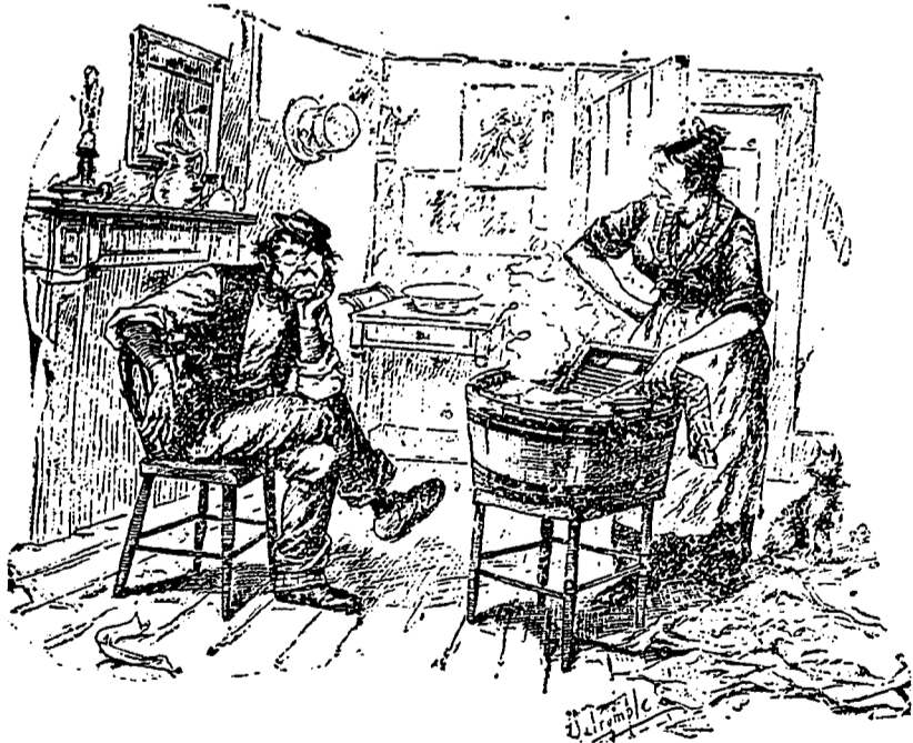
ELLE—Tandis que j'me morfonds tu ivrognasses, vieille teigne, qu'est-ce que t'a fait là, les yeux bouchés..... LUI—C'est pas ça ! J'peux pas supporter...hic...la rue d'eau...