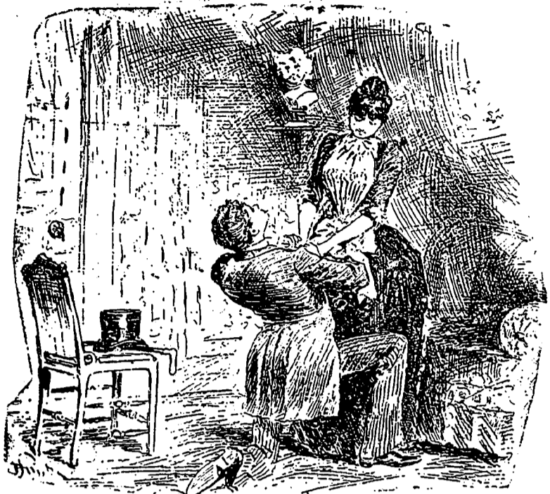
LUI—Je t'aime !... Je t'aime, ô mon ange, et jamais je..... (La porte s'ouvre vivement.)