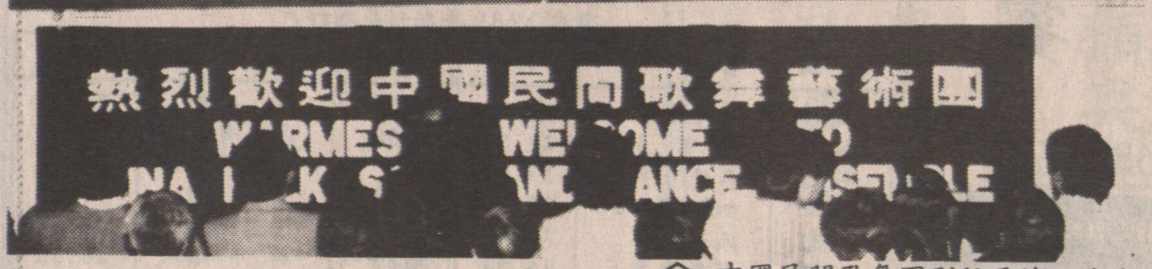
中國民間歌舞團到訪雲埠，在中華文化中心義演時，本埠音樂家同場助慶。