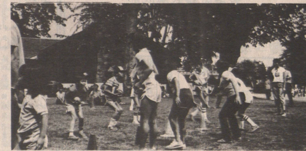
夏季郊遊小朋友活動的場面