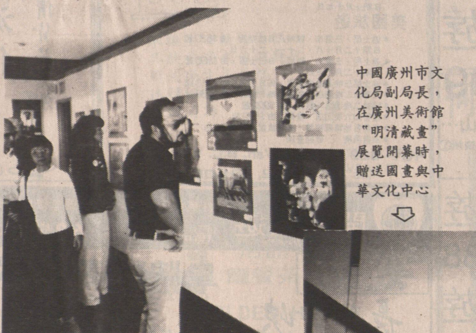
中國廣州市文化局副局長，在廣州美術館「明清藏畫」展覽開幕時，贈送國畫與中華文化中心