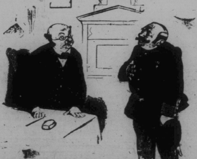
Fandrichter: ... Den verhafteten Raubmörder haben Sie wieder freigelassen! Da hört sich doch alles an! Daripolizist: „Ja hab' n' ja vorher verhört — er ist unschuldig!“

B.: O, der eine Bruder hat schon große Kinder und keine Schulden und der andere eine Menge kleine Kinder und große Schulden!