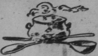
Für die Küche.