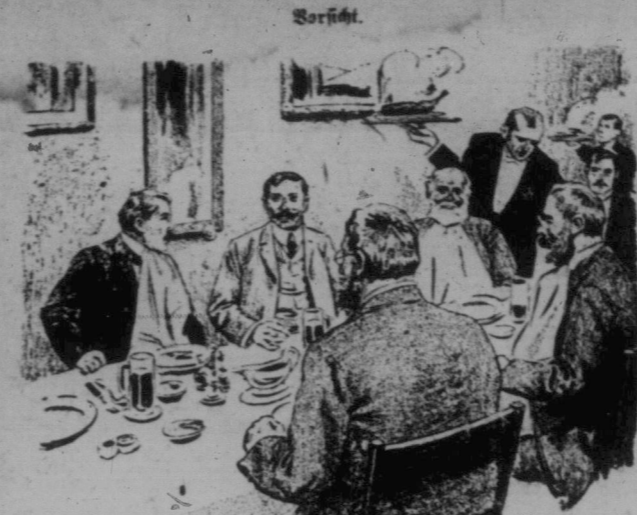
Reisender A.: Kann Herr Kollege, Sie trinken ja auch Bier zu Hause? Reisender B.: Ja, wissen Sie, im Vertrauen gesagt, der Bier trinkt nur meine Wachen!

Einige weitere Tipps. Bei alten Teppichen bringen die üblichen Reinigungsmethoden mit Soda, Salz, Teelöffeln und so weiter nicht die erwünschten Erfolge. Um sie wieder sauber zu bekommen und ihre Farben zu geben, ist eine gründliche Wäsche notwendig.