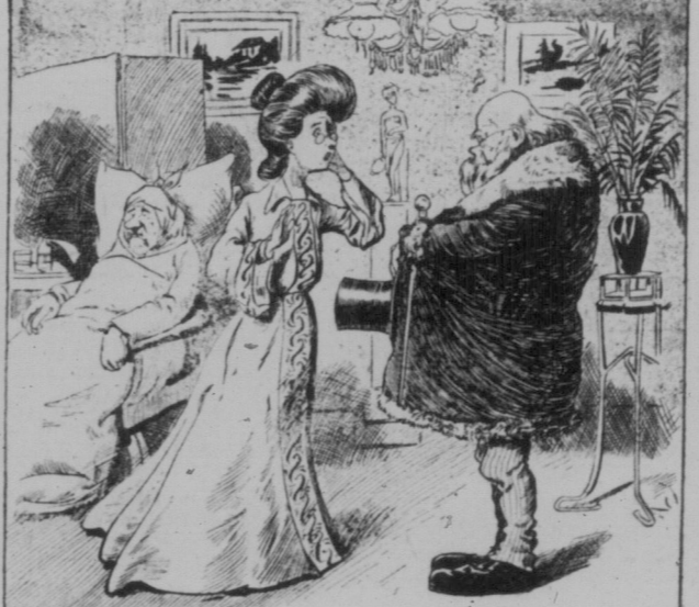
„Gnädige Frau, ich fürchte, daß sich bei Ihrem Herrn Gemahl Gelfundt einfallen wird.“ „Das wäre ja entsetzlich! Gelfundt ist so gar nicht zu unseren Zeiten!“

Leiner Moris: (nach einigen Minuten): Sie hätten doch schon telefonieren!