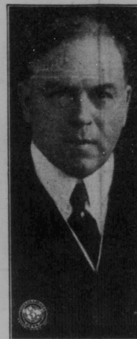
Rt. Hon. W. L. Mackenzie King, Premierminister.