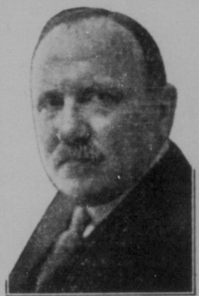
Hon. Ernest Lapointe, Justitienminister och generalprokurator.