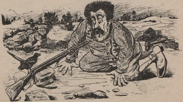
Le chasseur d'occasion (s'éveillant après un somme de digestion). — Sapristi, ne tirez pas ?

La découverte du BAUME RHUMAL est le fruit d'études et d'expériences suivies faites dans l'intérêt de l'humanité.