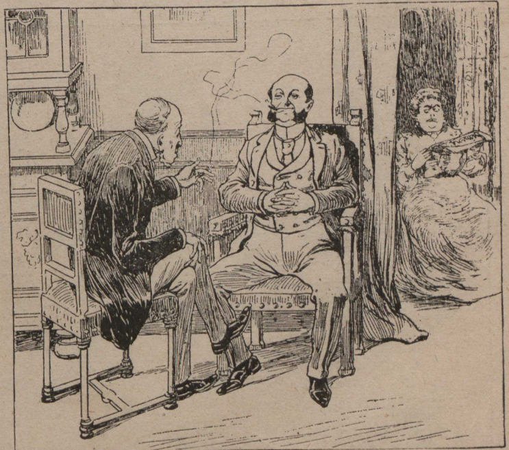
—Mais pourquoi, dites, voulez-vous donner la main de votre fille à M. Ernest, puisque vous le détestez ? —Mais si, c'est justement pour ça ; comprenez que j'ai envie de lui donner ma femme comme belle-mère.

—Si le monde ne met point le holà au désir effréné de liberté qui s'est emparé tout récemment du cœur du beau sexe, nous craignons fort que nos enfants ne soient, avant peu, obligés d'aller courtoiser leurs belles sur le toit des maisons, au haut d'une échelle. Heureux ceux qui les rencontreront sur la surface de notre planète, soit à l'établi, soit derrière un comptoir. D'après un dernier recensement, on en est ar-