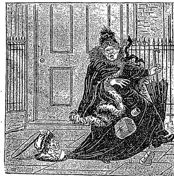
—Dites-donc-vous ! vous pouvez pas demander pardon quand vous marchez sur la tête du pauvre monde !