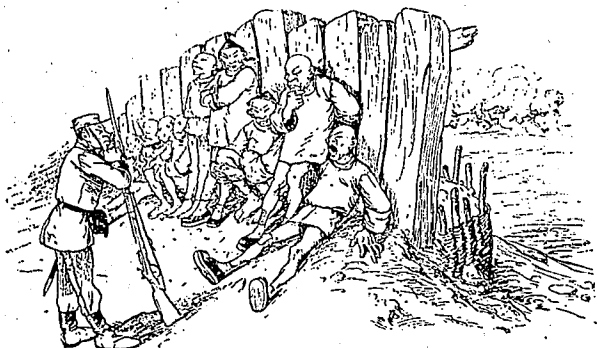
Moyen ingénieux adopté par les Japonais pour empêcher leurs prisonniers de s'enfuir.