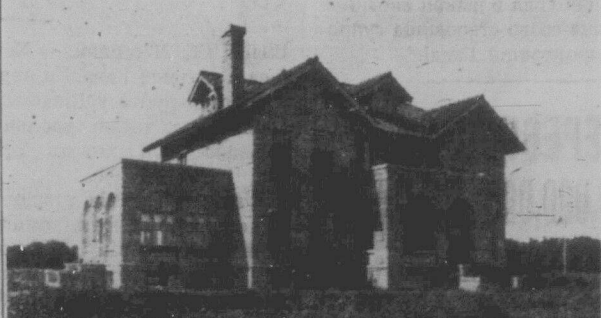
Менший будинок, призначений на сиротинище.

Великий будинок приюту РЗТ. У нєму тепер відбувається Вищий Освітній Курс.