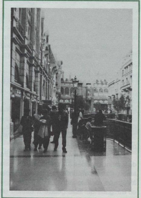
Agrémentée de fontaines, Europa Street est une rue dont l'architecture rappelle Versailles.

Le West Edmonton Mall sera alors si gigantesque qu'il sera desservi par trois restaurants McDonald.