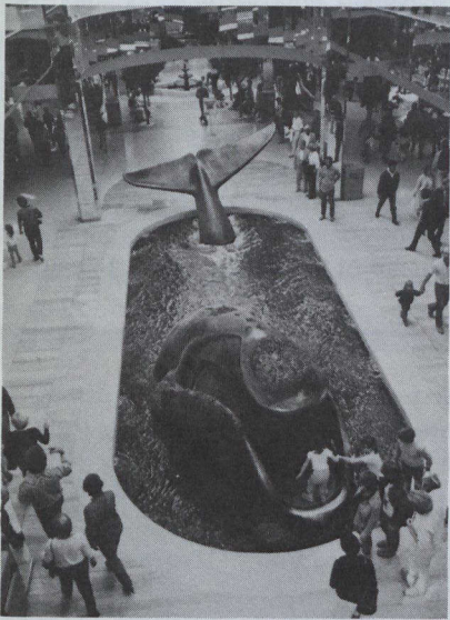
Cette baleine artificielle est l'une des nombreuses attractions destinées à amuser les enfants.