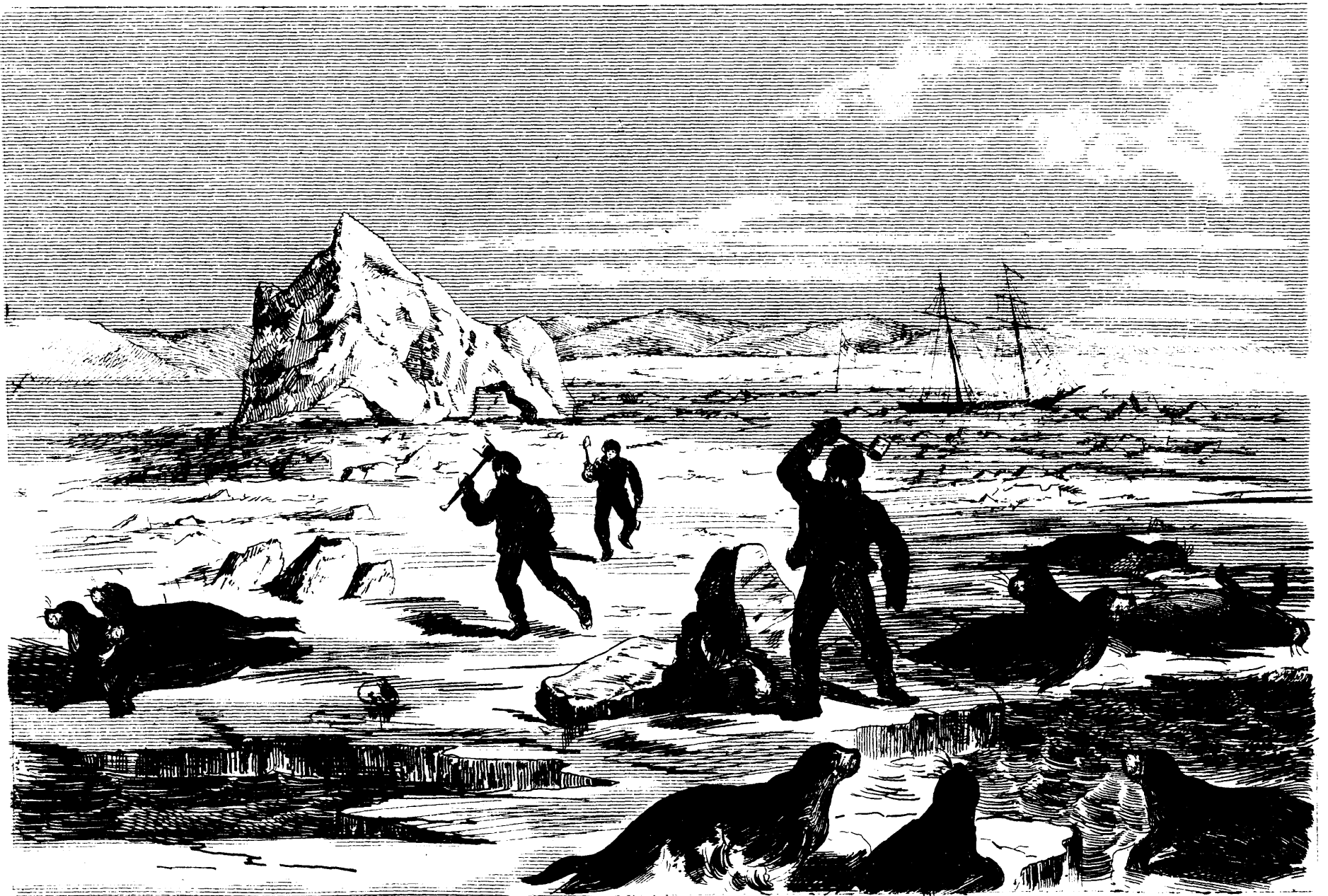
CHASSE AUX LOUPS-MARINS. D'APRÈS UN CROQUIS DE M. N. TETU.