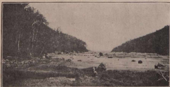
Entrée de la rivière Mistassini