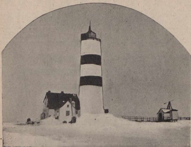
Pointe des Monts—Le Phare