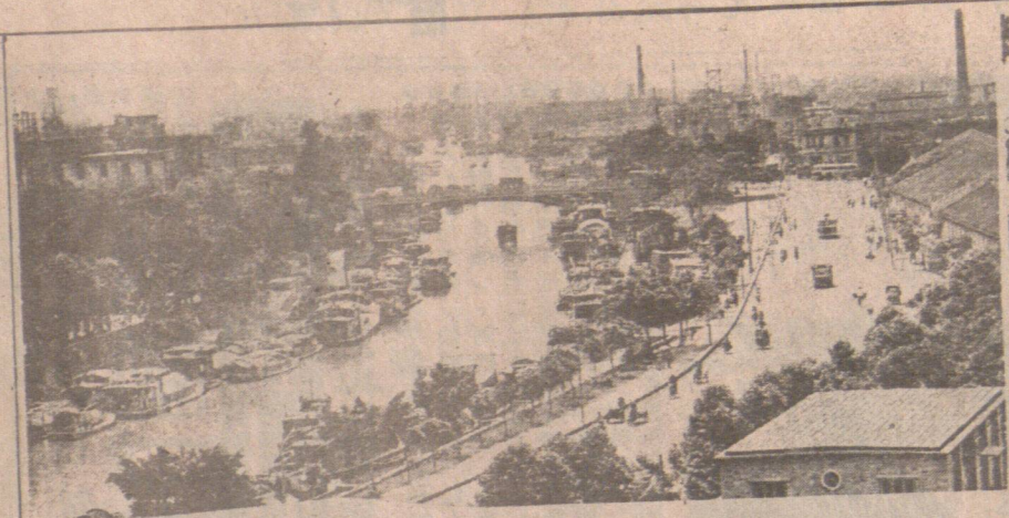
。區業工的畔河江汾山佛